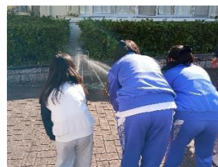
合同防災体験の様子

西部所・支所の配管済みのGood Newsは、以下の掲示板から御覧いただけます。